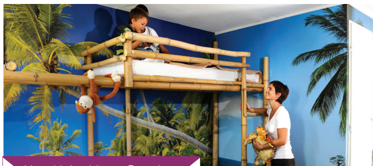
Hotel Jules Verne Premium