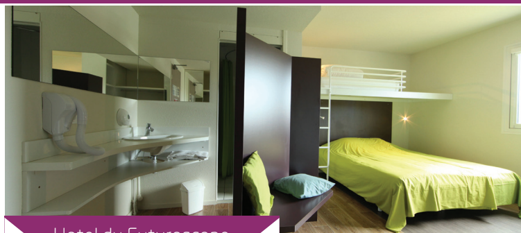
Hotel du Futuroscope