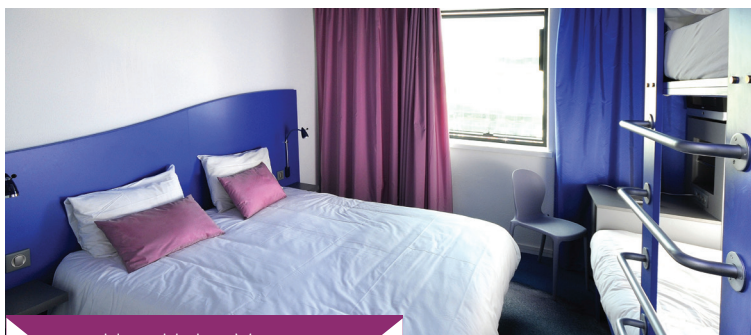
Hotel Jules Verne