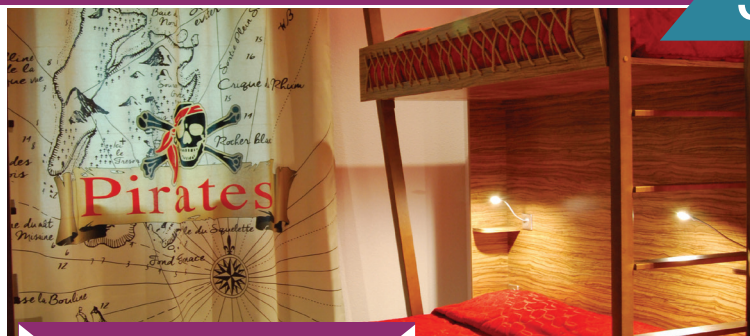
Hotel du Parc - Pirates